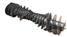
B : HARDOX 製ローター