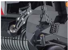
④ クロップローラー&ガード