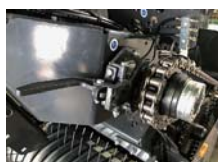
⑤ メカニカルクラッチ