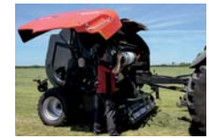
A : ネットバインディング