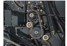
セカンドドライブ (高水分サイレージ向け)