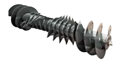
C : オプティフィードローター