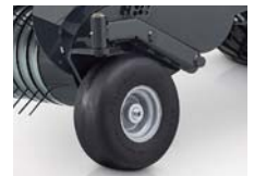
ピボットホイール

その他オプション：23枚ナイフカッティングモデル / ISOBUSモデル用ターミナル (CCI800/1200) / ● 標準装備 ○ オプション - 設定なし ピボット式ピックアップホイール / LED付カメラ (CCI800/1200用) / 無切断用ダミーナイフ