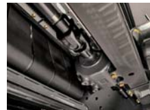
⑦ メインドライブシャフト