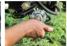
D : グループセレクション