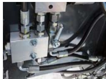
⑥ ナイフ&フロアバルブ